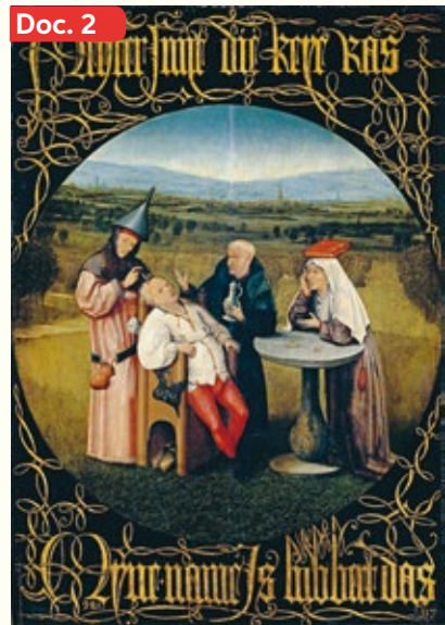
▲ La extracción de la piedra de la locura (finales del siglo XV) del autor holandés Jheronimus Bosch, también conocido como El Bosco. En sus obras el mundo medieval es retratado de forma grotesca y satírica.