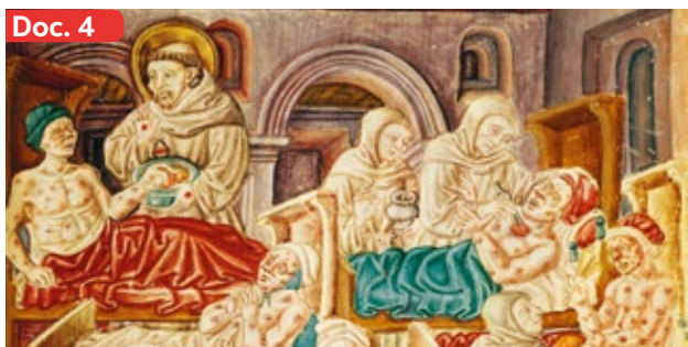
▲ Miniatura que representa a San Francisco atendiendo a enfermos de la peste negra (1477).

Los flagelantes de Tournai, Bélgica (1349). Los flagelantes constituyeron un movimiento católico radical que interpretó la crisis del siglo XIV como un castigo divino. Durante este período organizaron procesiones en las que se golpeaban con látigos y otros objetos para expiar sus pecados.