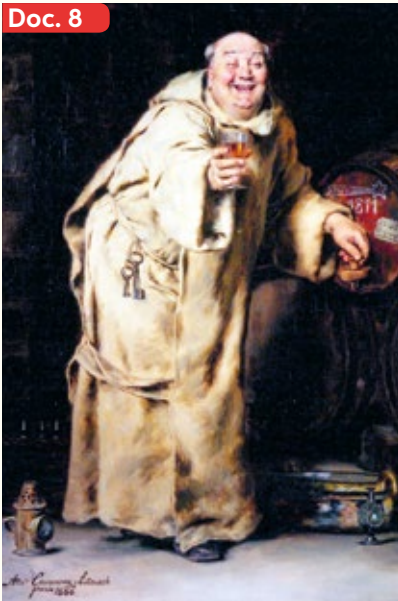
▲ Monje catando vino (1886), del pintor español Antonio Casanova, quien continúa una larga tradición artística que retrata a monjes u otras figuras eclesiásticas medievales disfrutando de los placeres mundanos de la vida, como la comida y la bebida.