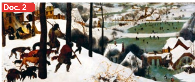
▲ Entre el siglo XIII y el siglo XIX la Tierra pasó por un largo período de enfriamiento que los científicos denominan Pequeña Edad de Hielo. Diversos pintores, han dejado testimonio de esta etapa. En la imagen, la obra Cazadores en la Nieve de Pieter Bruegel el Viejo (1565).

Durante este período también se desató una asoladora epidemia: la peste negra o bubónica (Docs. 1 a 5). Procedente de Asia, se introdujo en Europa en torno al año 1347, provocando la muerte de unos 25 millones de personas en Europa (Doc. 8). En medio de la mortandad, surgieron todo tipo de temores sobre castigos divinos y el fin del mundo (Doc. 5).