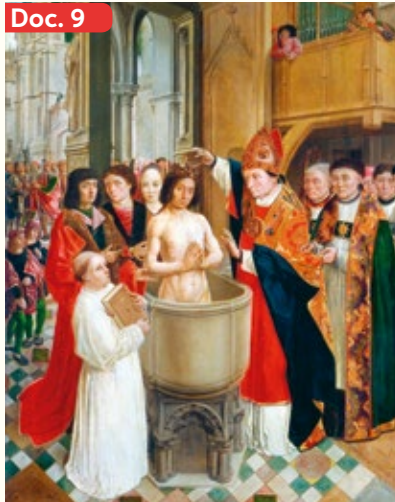
◀ El bautismo de Clodoveo I (1500 aproximadamente), obra del pintor franco-flamenco Mestre de Saint Gilles, que retrata el momento en que Clodoveo I, rey de los francos, adopta la religión católica (en el año 496 d. C), un hecho que impulsaría la conversión religiosa de muchos pueblos francos.